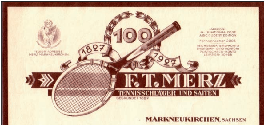
Briefkopf aus dem Jahr 1927.

Aus dem am 20. September 1934 angeordneten Verfahren der Zwangsversteigerung heraus wurde die Villa am 31. Januar 1935 an Dr. med. Gerhard Schmidt verkauft. Der Kaufpreis von 35.000 RM ging ausschließlich an die Banken, um die für Curt Merz bestehenden Hypotheken abzulösen. Gleichzeitig wurde ein Teil des Grundstücks Nr. 1203 als künftiges Flurstück 1203 b abgetrennt und von der Stadtbank für 8.000 RM übernommen. Somit konnte am 2. März 1935 die beantragte Zwangsvollstreckung zurückgenommen werden. Die weitere Geschichte vom Wohnhaus eines Arztes (mit Praxis im Kellergeschoss) über den Städtischen Kindergarten bis hin zum Sitz einer Fachschule für Instrumentenbau (1988), die 1992 zum heutigen Studiengang wurde, sei hier nur noch angedeutet.